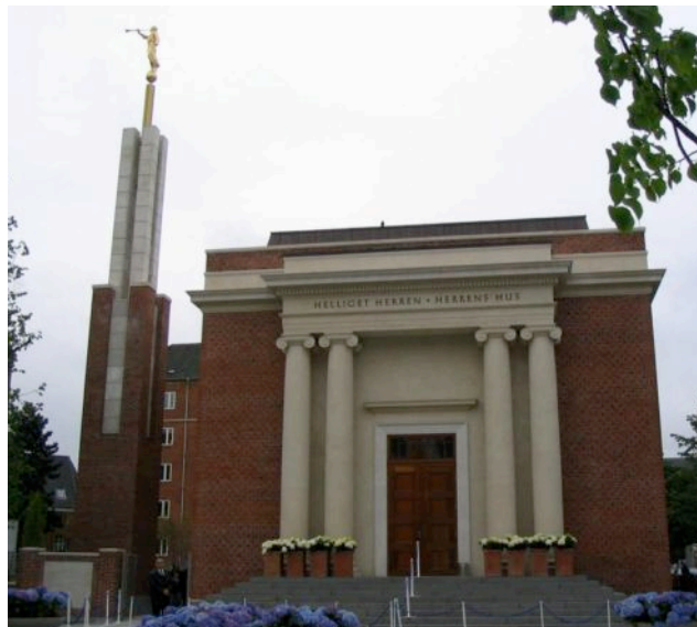
Le nouveau temple de Copenhague, pendant les journées portes-ouvertes. Sur le frontispice, l'inscription « Helliget herren - Herren hus ». Notre photo, Copenhague, le 12.05.04.

Qu'est-ce qu'un temple pour les Mormons ? Une "maison du Seigneur", "consacré[e] pour le Seigneur" : le lieu le plus sacré dans l'É.S.D.J. Ne peuvent y pénétrer que les membres confirmés depuis au moins un an et "certifiés