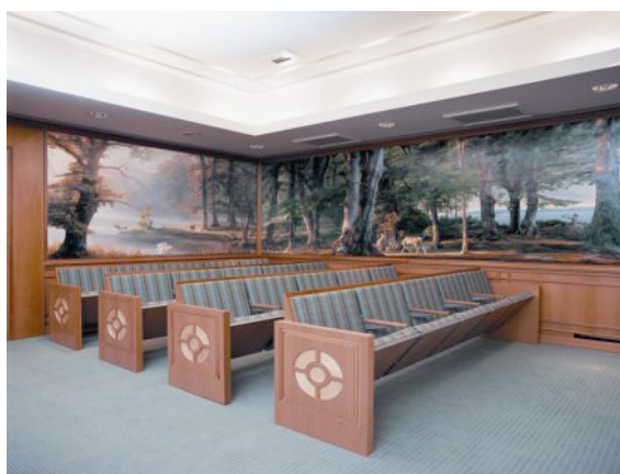
La première “salle d’ordonnance”.

L’évolution historique des rituels du temple joue enfin un rôle dans cette logique de séparation symbolique. On pourrait penser que l’écoulement du temps ait favorisé la divulgation du secret, ou du moins, l’abandon progressif des techniques visant à sa préservation. Or, dans le cas présent, il est possible que la politique mormone d’adaptation à la modernité ait induit le contraire en introduisant un autre type de silence dans le temple. Dans la “première salle d’ordonnance”, par exemple (v. photo qui suit), apparaît un écran destiné à la projection de films, mais se trouvent aussi des bornes (v. dans la partie supérieure de la photo, au centre, l’antenne en forme de boîtier disposé dans l’angle du plafond blanc) permettant de retransmettre le son par infra-rouge et dans la langue de chacun jusqu’au casque de l’initié. Les scènes jouées et les projections de films classiques sont ici remplacées par des moyens techniques plus récents qui ont finalement pour effet d’instaurer une nouvelle dimension silencieuse dans les lieux. On ne sait si cette conséquence est vraiment recherchée, mais, en tout cas, une atmosphère de confidentialité se dégage ainsi de la réception individuelle des messages.