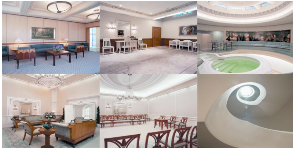
L’intérieur du temple. 45 (la prise de photo étant interdite à tous les visiteurs à l’intérieur de l’édifice)

La visite se termine enfin sous une tente dressée à proximité du temple. Des rafraîchissements y attendent les visiteurs. C’est à ce moment qu’interviennent les missionnaires 46 qui distribuent de petits cartons visant à recueillir les