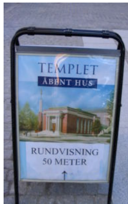
Annonce d'accueil des tours de visites, placée à une cinquantaine de mètre du temple. Copenhague 13.05.2004.

À Copenhague, comme ce fut le cas plus récemment encore à Manhattan 35 , l'É.S.D.J. n'a pas choisi d'édifier une nouvelle construction. Peut-être cela dénote-t-il d'ailleurs une nouvelle politique architecturale : faire du neuf avec du vieux et, pourquoi pas, du plus secret avec du moins sacré. Dans le cas danois, le nouveau temple a été ainsi conçu à partir de la restauration et de l'adaptation d'une chapelle datant des années 1930. Les habitants des environs étaient donc accoutumés depuis fort longtemps à l'aspect extérieur du monument, du moins à un détail près : la statue de l'Ange Moroni 36 , qui caractérise traditionnellement tous les temples mormons, ayant été ajoutée.