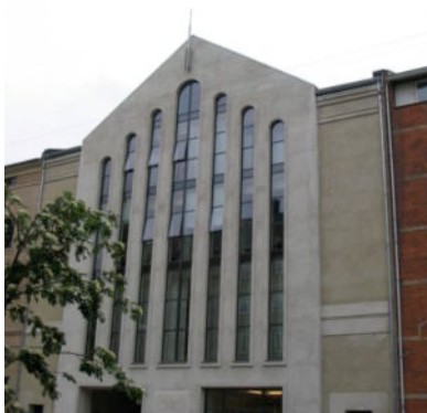
La chapelle de Copenhague (Frederiksberg). N.p., 12.05.04

de son propriétaire, ils conduisent les visiteurs dans une salle où est projeté un film comprenant un historique et une présentation des temples mormons (avec des photos d'autres sites dans le monde) mais surtout l' interview de membres, d'"autorités" et du "prophète" de l'É.S.D.J. justifiant l'intérêt de ces constructions et des rites qu'elles abritent. Puis les guides fournissent des recommandations encadrant la visite (interdiction de toucher, silence, etc.) et divisent l'assistance en deux sous-groupes 40 .