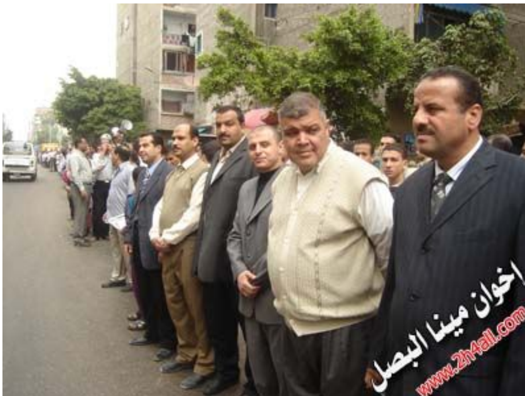
... et manifestation de Frères musulmans à Alexandrie.

C'est ensuite durant les années d'exil lors de la période de répression nassérienne qu'une véritable classe d'affaire Frère se structure dans les pays du Golfe alors en plein décollage économique. Des personnes comme Youssef Nada, Abdelazim Luqma, Helmi Abdel-Meguid ou Moustapha Mo'min portèrent ainsi l'étendard de la confrérie dans le champ économique, principalement dans les domaines de la construction et de l'import-export.